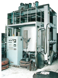
特殊プレステンパー炉