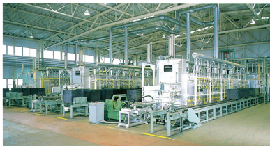
無人運転無酸化球状化焼鈍炉