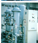
PSA式N 2 ガス発生装置